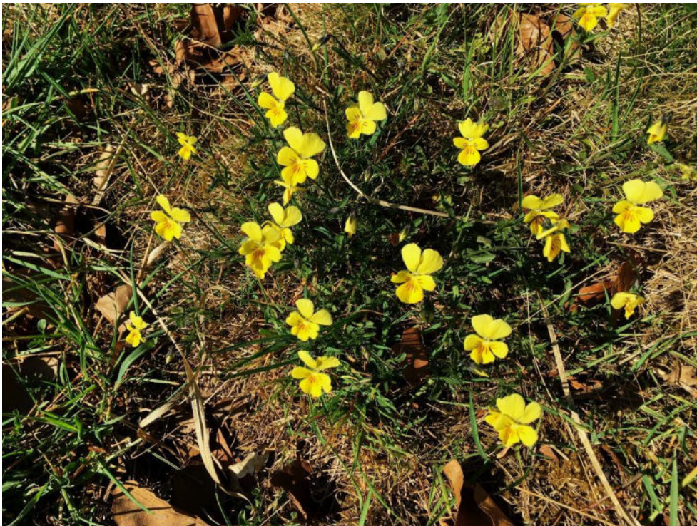
Galmei-Veilchen auf dem Schlangenberg